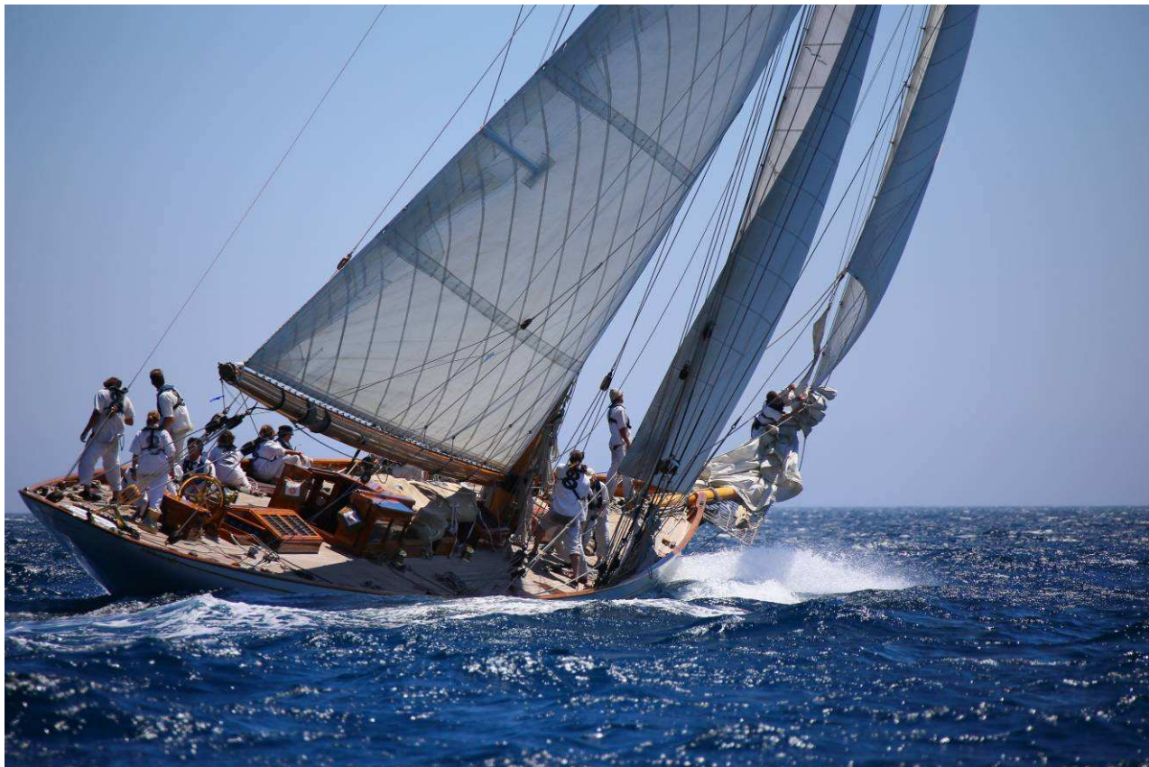
Moonbeam IV