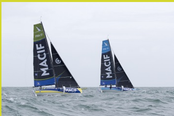
Premières navigations des skippers Macif