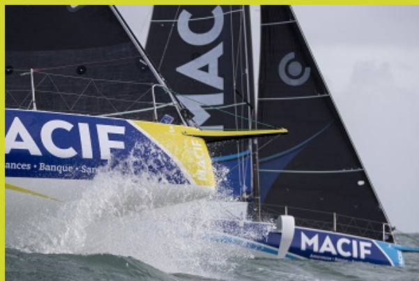
Premières navigations des skippers Macif