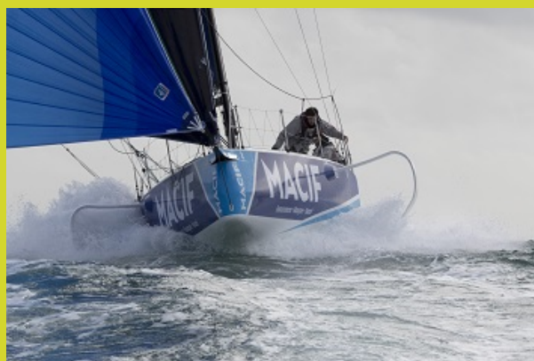
Le Figaro n°10 de Pierre Quiroga, Skipper Macif 2019