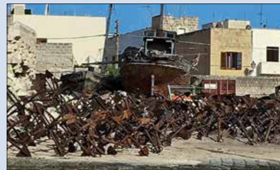
Sur la grève, un amas d'ancres rouillées d'anciens thoniers évoquent une installation artistique digne du sculpteur César.

fond de sable de 2 m est réputé de très bonne tenue. Le seul impératif est de se tenir à distance des ferries qui entrent et sortent comme à l'accoutumée plein pot, après avoir débarqué leurs voyageurs en provenance de Trapani sur la côte sicilienne à huit milles de distance. Nous voilà donc seuls, mouillés dans l'eau turquoise, à quelques encablures du petit port où s'agglutinent les chalutiers et quelques pointus siciliens. On distingue sur la droite d'immenses hangars qui abritaient jadis les énormes barques de la Matanza, cette chasse traditionnelle au thon d'un autre âge, mais plus respectueuse des réserves que les bateaux-usines japonais qui raclent désormais le plateau continental sicilien. Non loin de là, un singulier tas d'ancres marines rouillées, qui servaient à l'amarrage des fameuses barques, fait désormais le bonheur des pho-