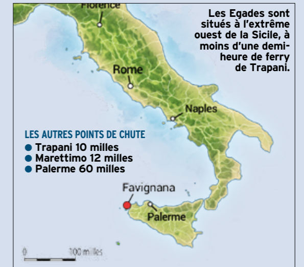
Thons et espadons ont fait pendant des siècles la richesse de Favignana.