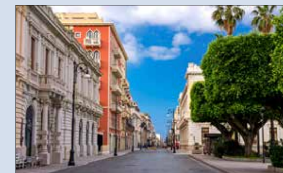
Le cœur de ville possède de grandes avenues où l'on trouve des maisons de style Art nouveau, édifiées après le tremblement de terre de 1908.

Corse. Nous voilà au musée. Incroyable institution, inventaire antique superbe. La ville est belle, la végétation ravissante et si la Camorra locale ni le touriste n'en ressentent les néfastes effets. Le long de la promenade sur la mer, les glaces sont délicieuses, l'ambiance de fin d'après-midi à nouveau fabuleuse. Savino tarde un peu, la Mercedes pétaradante surgit d'une ruelle. Alcoolémie stable. Il insiste, nous balade dans sa ville, nous la fait