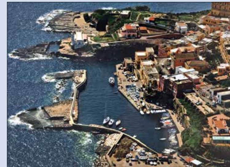
Le port est édifié dans la roche volcanique, formant un cocon exigu mais relativement bien protégé.

La journée, c'est bain dans la piscine creusée par les esclaves d'Agrippine dans laquelle la mer entre avec la houle. Pour en sortir, on tient la corde sur le bord et l'on attend la vague qui vous remonte