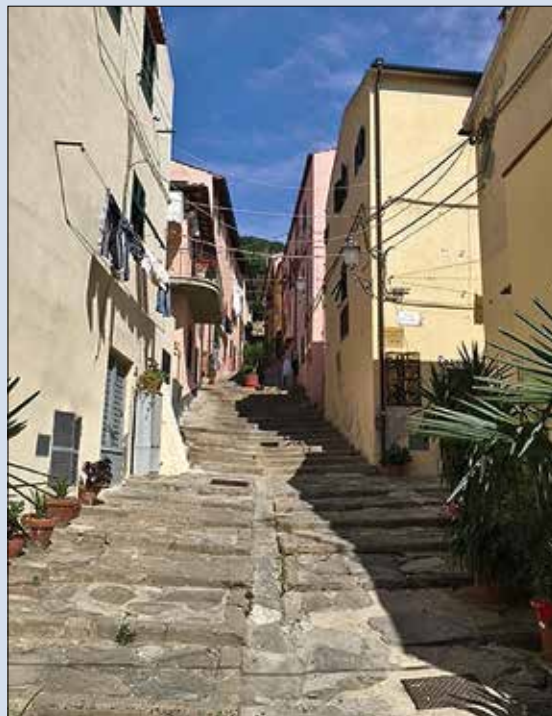
Les rues grimpent sévèrement tout autour du port.

E n remontant du sud, l'atterrissage sur Porto Azzurro ne présente aucune difficulté pour une fois! Le port est implanté à la pointe sud-est de l'île. La rade est immense avec 2 à 3 m de fonds de vase de bonne tenue, bien protégée des vents dominants. En bout de baie, une zone technique peut dépanner la plupart des tracas techniques. Des petites criques, plus à l'écart, peuvent servir de mouillage si vous recherchez plus d'intimité. Tout ou presque est alors à portée immédiate d'annexe pour vous permettre de visiter cette petite ville balnéaire, le joyau de l'île d'Elbe. Avec ses boutiques chics et ses charmantes ruelles, Porto Azzurro a des airs de Saint-Tropez miniature. L'endroit regorge de bonnes tables et de galeries d'art. L'apéro sur la place est un incontournable avec quatre ou cinq sortes de Spritz et leurs amuse-gueules à mourir. La sûreté du mouillage forain autorise d'abandonner le bateau sans surveillance et d'aller visiter la capitale Porto Ferraiu, dont la riche et courte histoire napoléonienne vaut le détour. C'est à un quart d'heure en