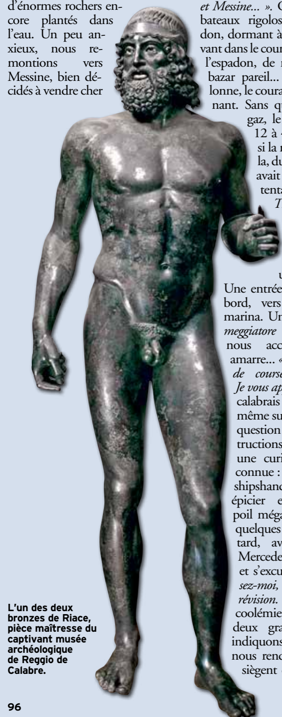
L'un des deux bronzes de Riace, pièce maîtresse du captivant musée archéologique de Reggio de Calabre.