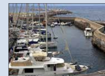
Le port antique est très étroit mais on peut y amarrer des bateaux de 50 pieds à l'image du Swift Trawler 52 Paya Bay au premier plan.

sur la berge. Sensations garanties (sparadrap aussi, si l'on se loupe, avec en plus la bronca des gamins du village !). Le club local organise des plongées sur des tombants vertigineux où s'agitent des gorgones géantes. Le soir, on regagne la place du village pour jouer aux boules, boire le Spritz, faire la « passeggiata » avant le resto sur le petit port. L'envie vous prend alors de ne jamais partir, pour un peu que l'on commence à sortir sa boîte d'aquarelles. Le lieu vous