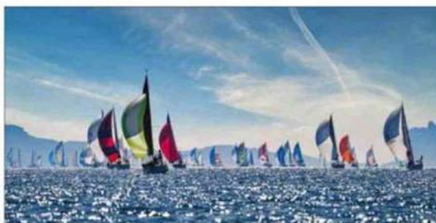
Sous spi, la Semaine nautique internationale de Marseille, la régate-phare de la SNM, se déroule chaque année lors du weekend de Pâques.

tions, seront autant de variantes pour enrichir votre séjour.